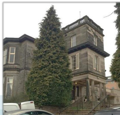
Halifax Hall hvor kurset blev afholdt

Kursisterne havde et stort udbytte af kurset og oprettede gode relationer til potentielle, fremtidige samarbejdspartnere.